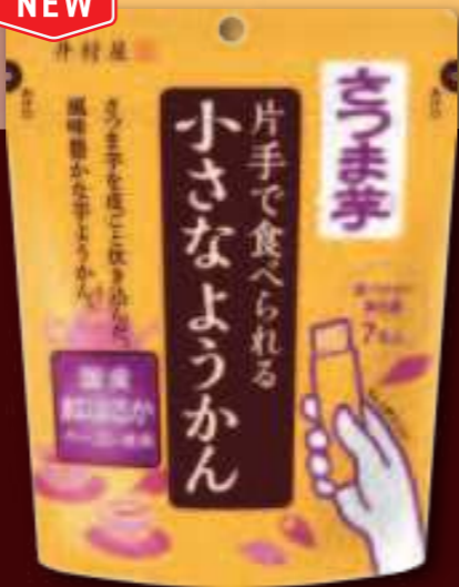
片手で食べられるさつまいもようかん 14g×7本入

POINT ● 押すだけで食べられる「ギュッと押すだけパッケージ」(特許第6114206号) ● 食べきりサイズ ● 7本入