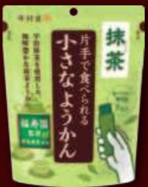
片手で食べられる抹茶ようかん 14g×7本入