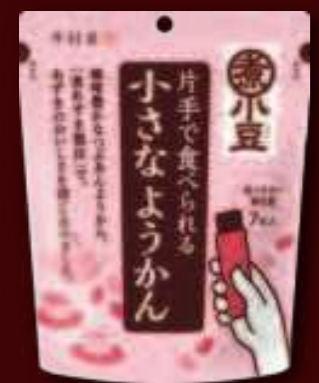
片手で食べられる小豆ようかん 15g×7本入