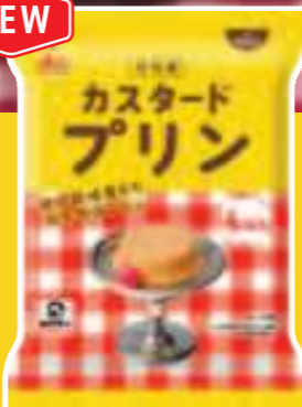
袋入 カスタードプリン