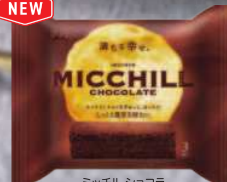
ミッチル ショコラ