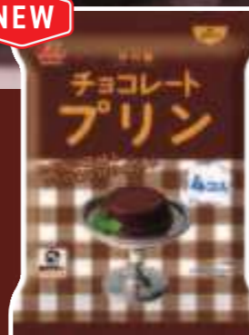
袋入 チョコレートプリン